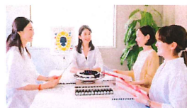
13 ニューゼalandフラワーエッセンス・ジャパン