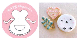
05 HARU icing cookies