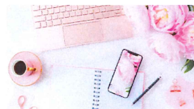
04 藤沢商工会議所女性会