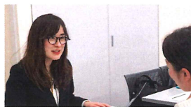
02 ウーマンネット株式会社