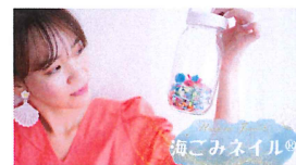
14 Plumeria Nail