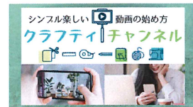
16 クラフティチャンネル