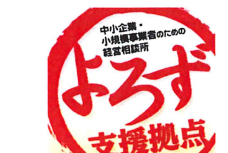
03 神奈川県よろず支援拠点

女性経営者の団体である女性会は、働く女性や起業したい女性を応援しながら、地域経済の活性化を目指しています。