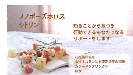
08 メノポーズホロスシトリン