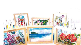
10 art salon rainbow