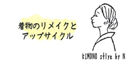
06 KIMONO style by N