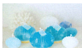
07 ~空と海のキャンドル~ Lani&Kai Mood

ハーブを学ぶだけで終わらせない。使いこなせ伝える人材へ。神奈川県で唯一、初級→中級→上級と学べるJHSハーブインストラクター資格養成校です。ハーブ商品、野菜やブーケの販売ブース。ハーブティーのブレンド体験ブース。無料相談も受け付けます。